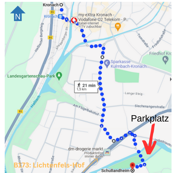
Laufweg vom Kronacher Hauptbahnhof zum Schullandheim

zz. Vor- und Nachbereitung (meist am Abend oder nach Parteeende)